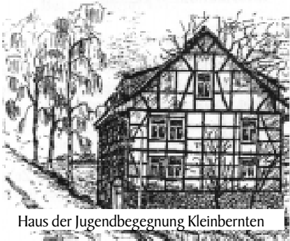
Haus der Jugendbegegnung Kleinbernten

An diesem Tag der offenen Tür wurden die Ergebnisse der Arbeit des Big Dipper e. V. vorgestellt - eingebettet in ein großes Dorffest, welches auch durch den Heimatverein Kleinbernten tatkräftig unterstützt wurde.